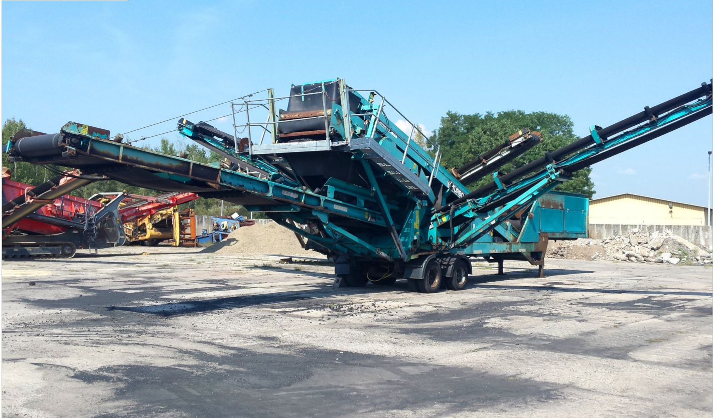
Przesiewacz kołowy POWERSCREEN Chieftain 1400