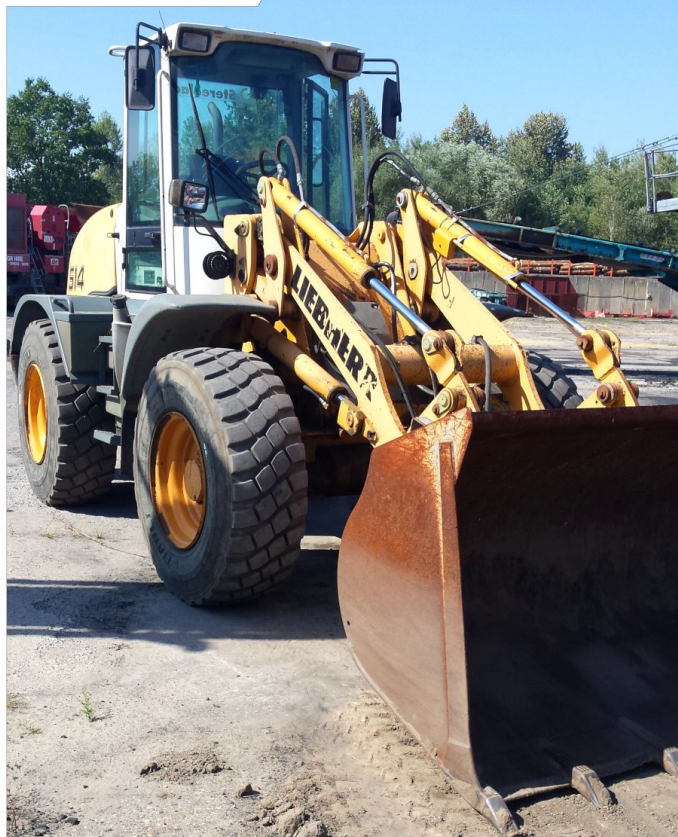
Ładowarka kołowa LIEBHERR L514