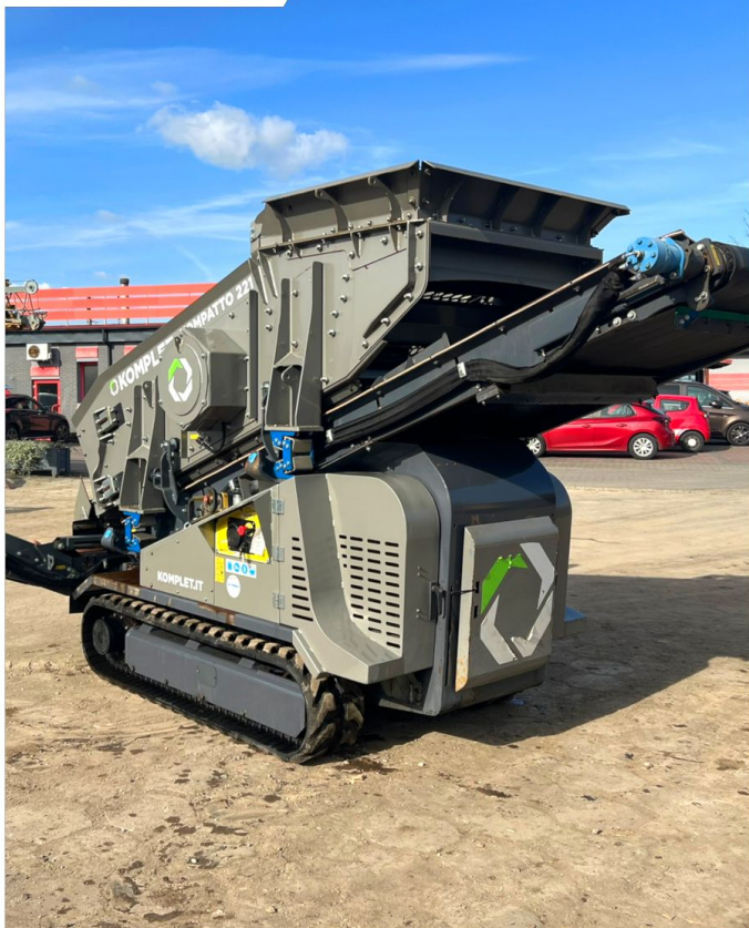
Przesiewacz KOMPLET Kompatto 221