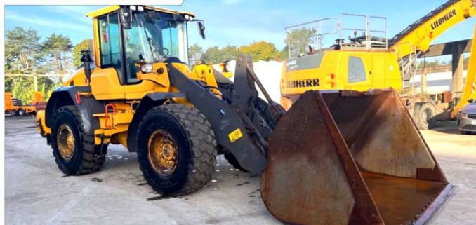
Ładowarka kołowa VOLVO L90H