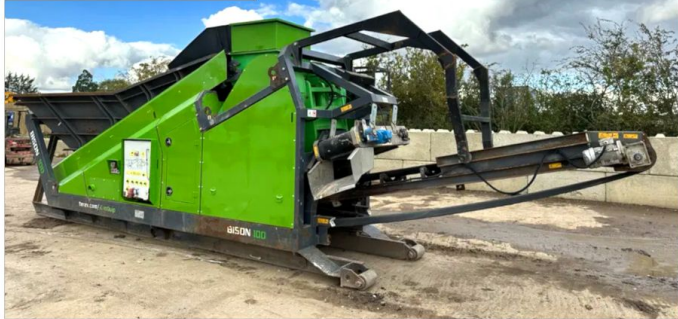
Kruszarka szczękowa TEREX BISON 100 EVOQUIP