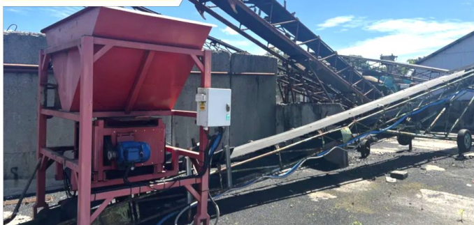
Linia produkcyjna do ekogroszku