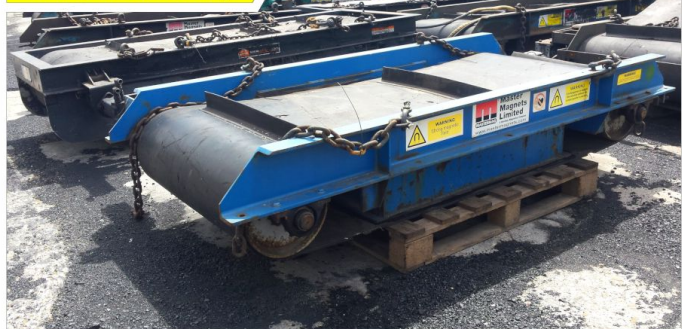
Magnesy MASTER MAGNETS, TEREX, ERIEZ (6 szt.)