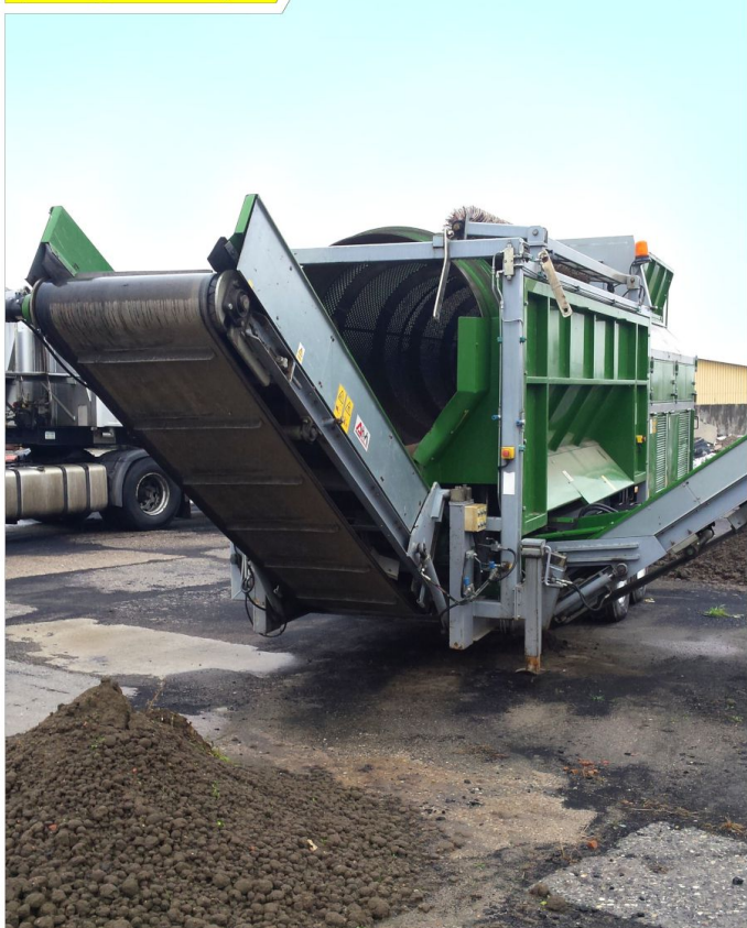
Przesiewacz bębnowy LUXOR SOP-1445-2/D