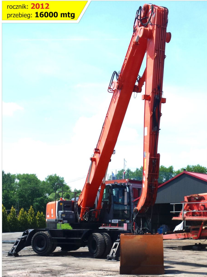
Koparka przeładunkowa HITACHI ZX360 W-3