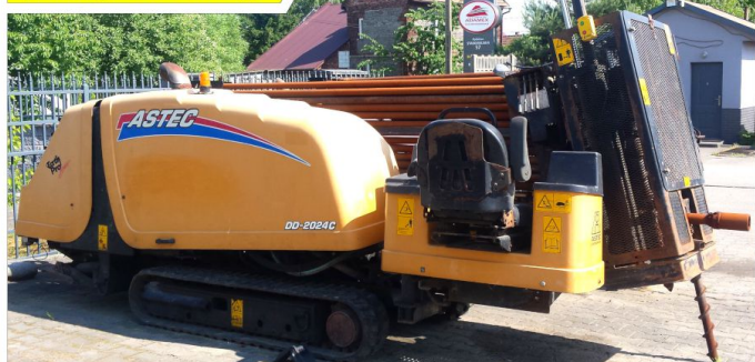
Wiertnica horyzontalna ASTEC DD2024C