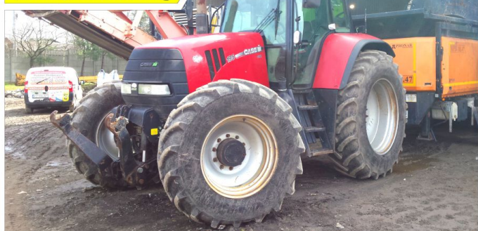
Ciągnik rolniczy CASE IH CVX 195