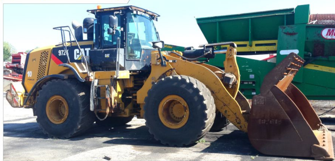
Ładowarka kołowa CATERPILLAR 972K