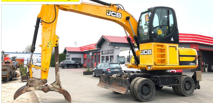
Koparka kołowa JCB JS160W High Cab