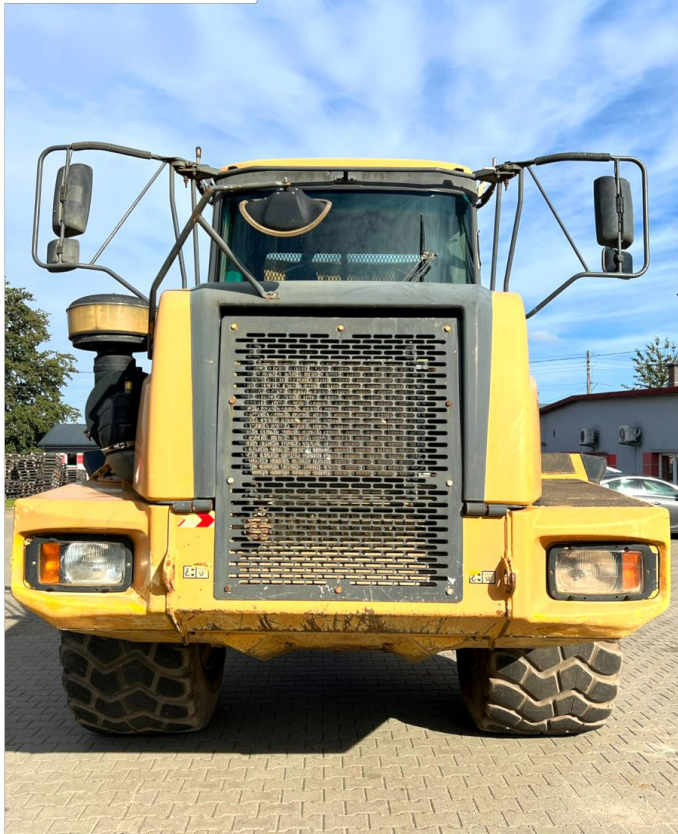
Wozidło przegubowe BELL B30D