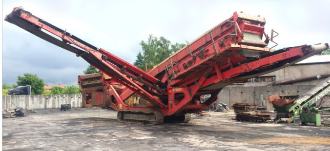
Przesiewacz SANDVIK QA340