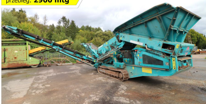
Przesiewacz POWERSCREEN Warrior 800