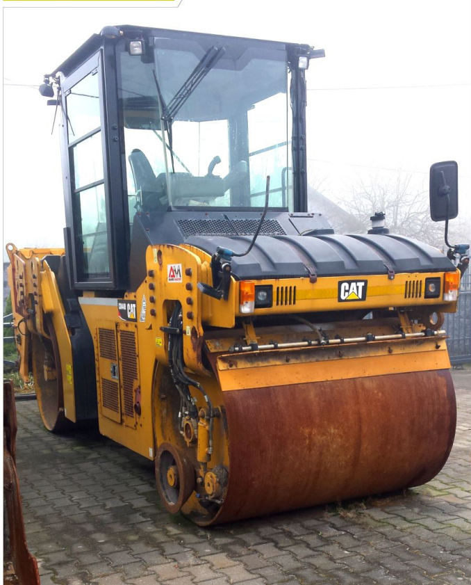
Walec drogowy wibracyjny CAT CB44B