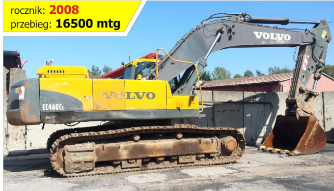
Koparka gąsienicowa VOLVO EC460 CL