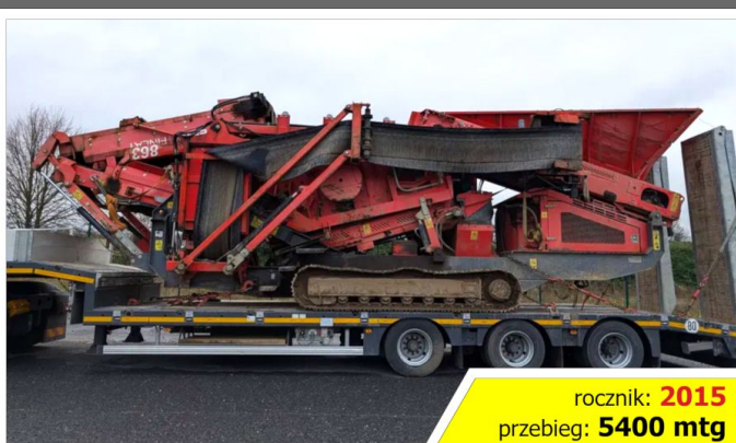
Przesiewacz EXTEC E7