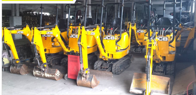
Koparka gąsienicowa JCB 8008 (7 szt.)