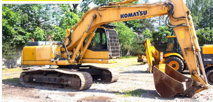
Koparka gąsienicowa KOMATSU PC210 LC-8