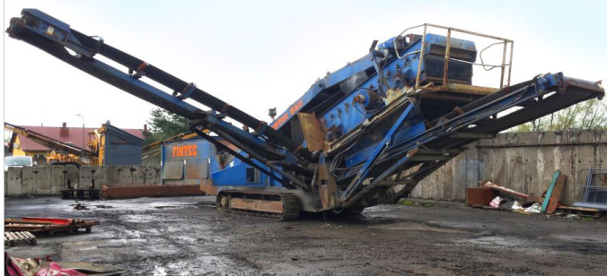
Przesiewacz FINTEC 540