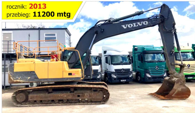
Koparka gąsienicowa VOLVO EC220 DL