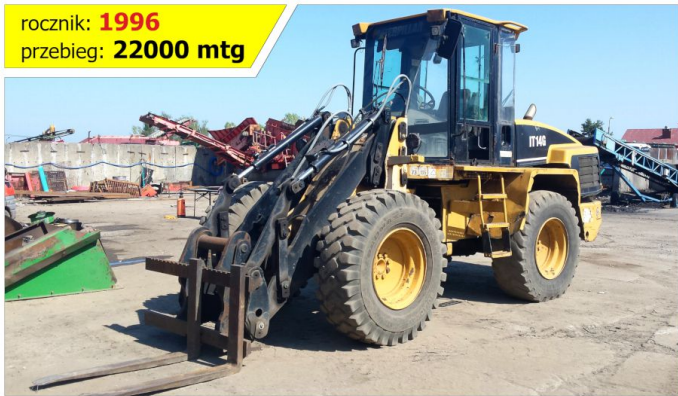
Ładowarka kołowa CATERPILLAR IT14G