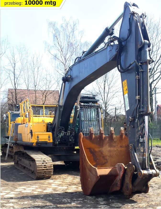
Koparka gąsienicowa VOLVO EC250 DL