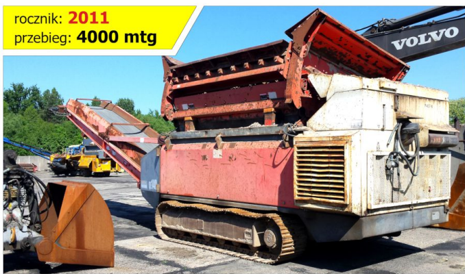
Przesiewacz SANDVIK QE140