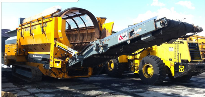
Przesiewacz bębnowy ANACONDA TD 620