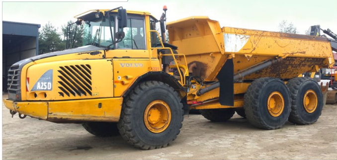
Wozidło przegubowe VOLVO A25D