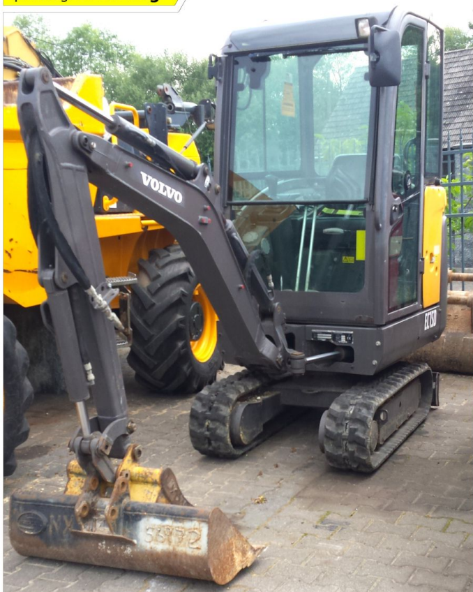
Koparka gąsienicowa VOLVO EC15D