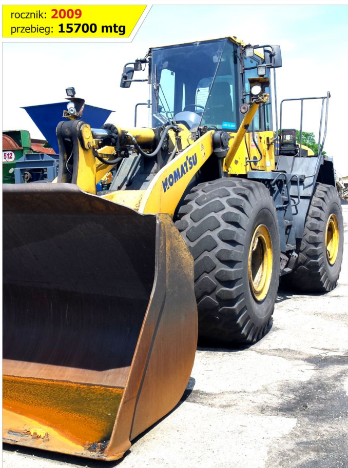
Ładowarka kołowa KOMATSU WA470-6