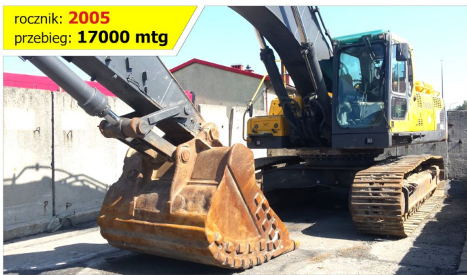
Koparka gąsienicowa VOLVO EC460 BLC