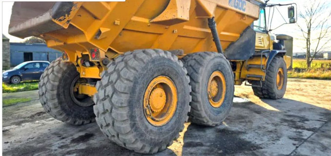
Wozidło przegubowe BELL B30D