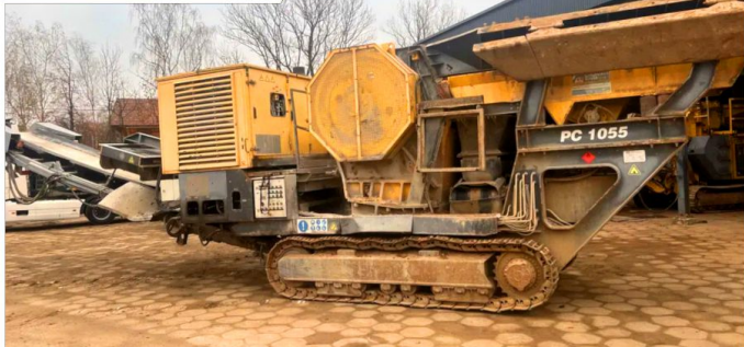
Kruszarka szczękowa ATLAS Copco PC 1055