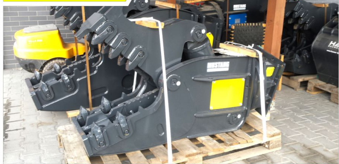
Nożyce wyburzeniowe MUSTANG RH12, RH15, RH20, RH25