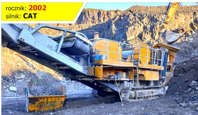
Kruszarka szczękowa PARKER RT16