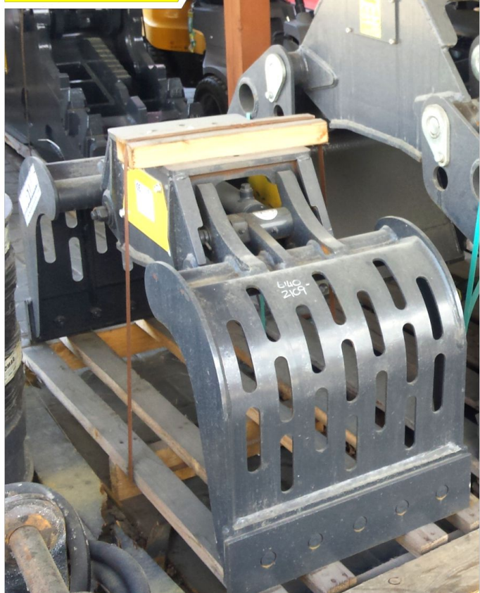
Chwytnak do koparki MUSTANG GRP250 SR