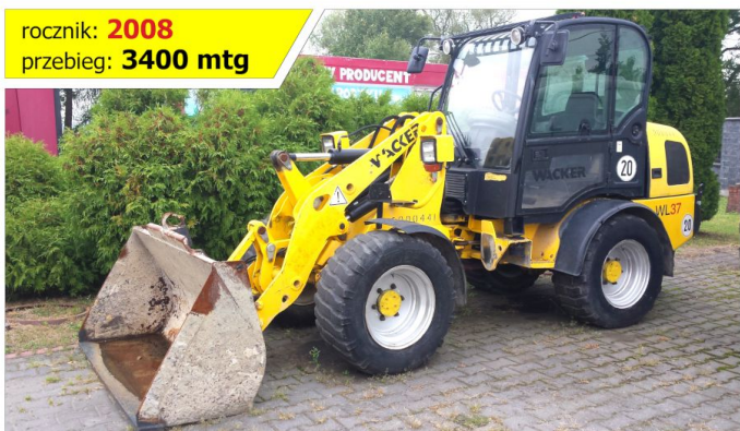
Ładowarka kołowa WACKER Neuson WL 37