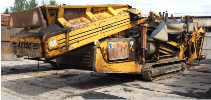
Przesiewacz EXTEC E7