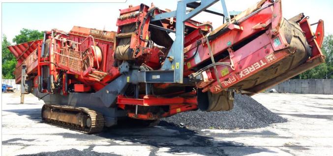
Przesiewacz TEREX Finlay 883