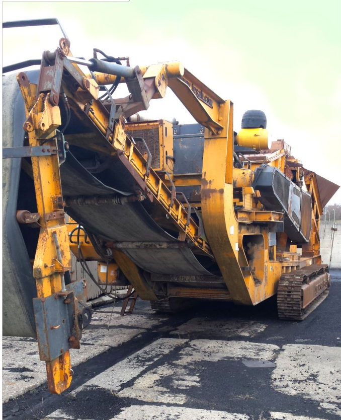
Kruszarka udarowa TESAB 1412T