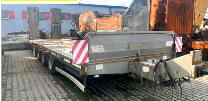
Niskopodwoziowa przyczepa KH-Kipper