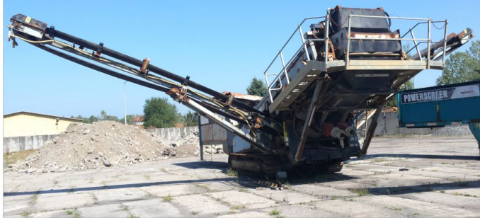
Przesiewacz na mokro TEREX M1400