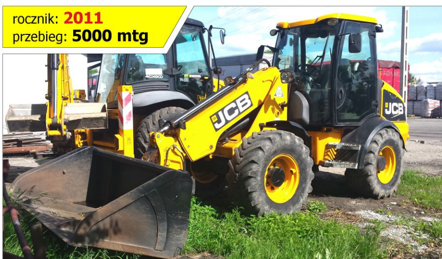
Ładowarka teleskopowa JCB TM220