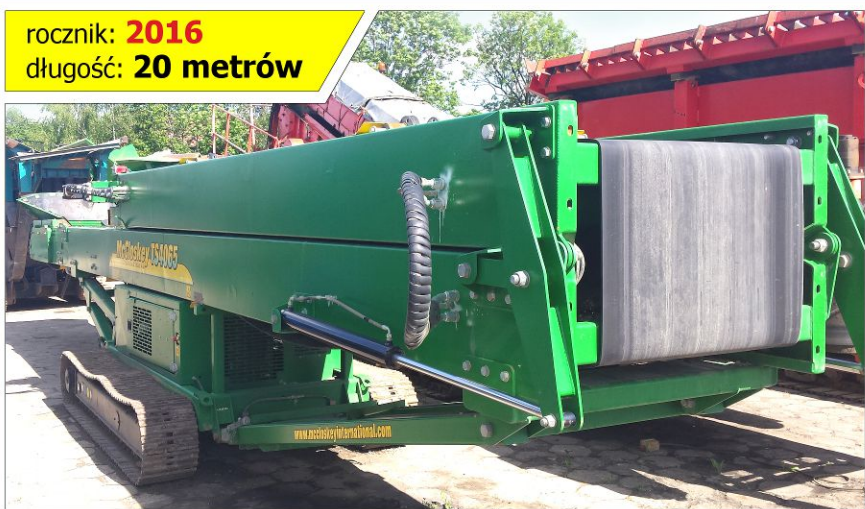
Mobilna taśma przenośnikowa McCLOSKEY TS4065