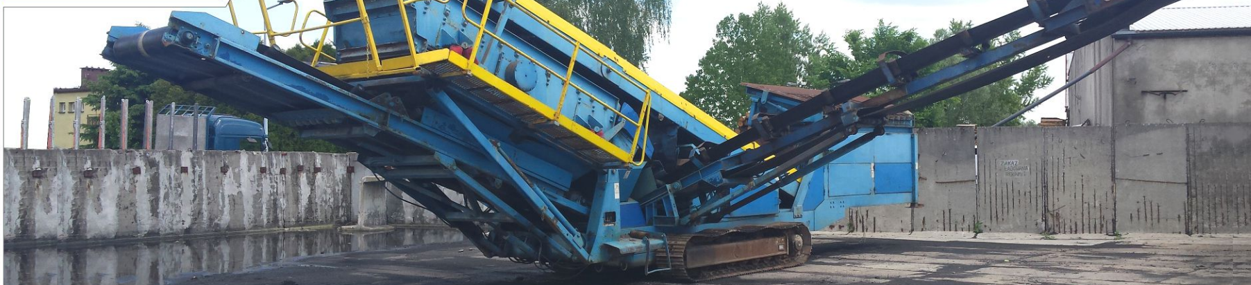
Przesiewacz FINTEC 540