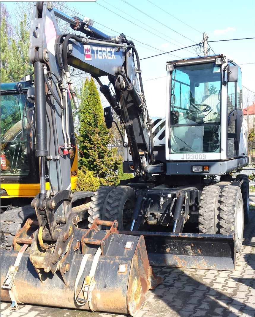
Koparka kołowa TEREX TW70