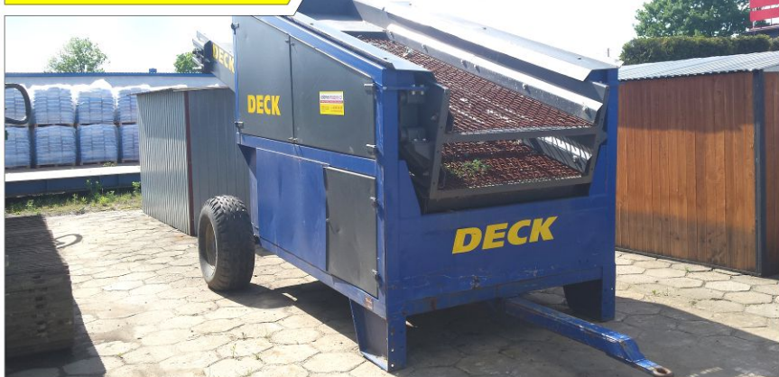
Przesiewacz kołowy TB 84