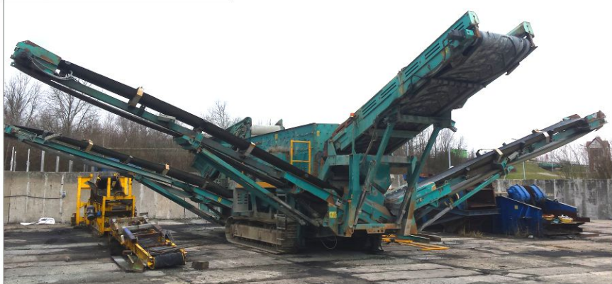
Przesiewacz POWERSCREEN Horizon 5163