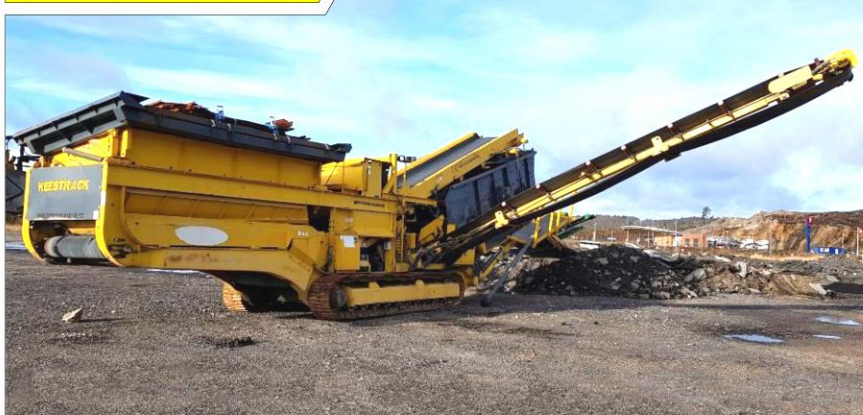
Przesiewacz KEESTRACK Explorer 1800