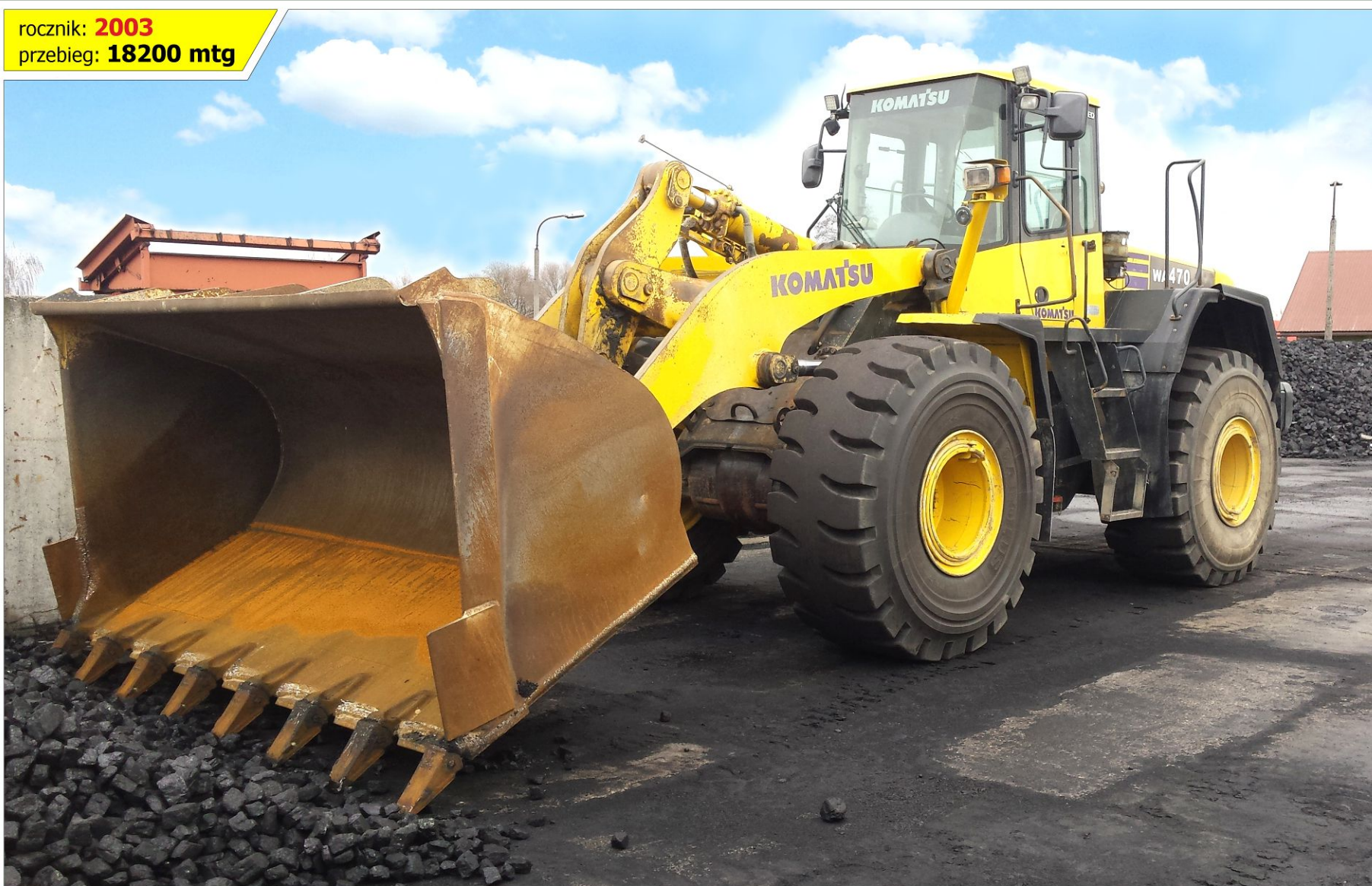
Ładowarka kołowa KOMATSU WA 470-5H