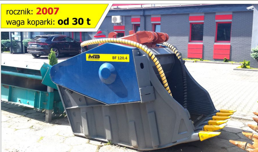
Łyżka krusząca MB BF 120.4