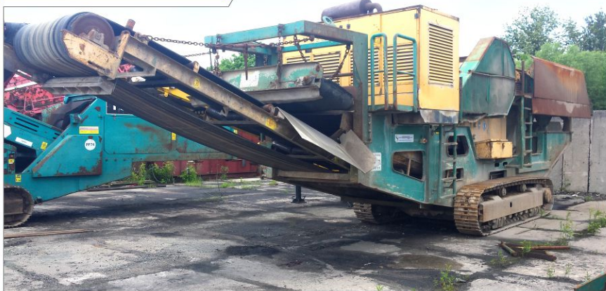
Kruszarka szczękowa MFL 100-60T