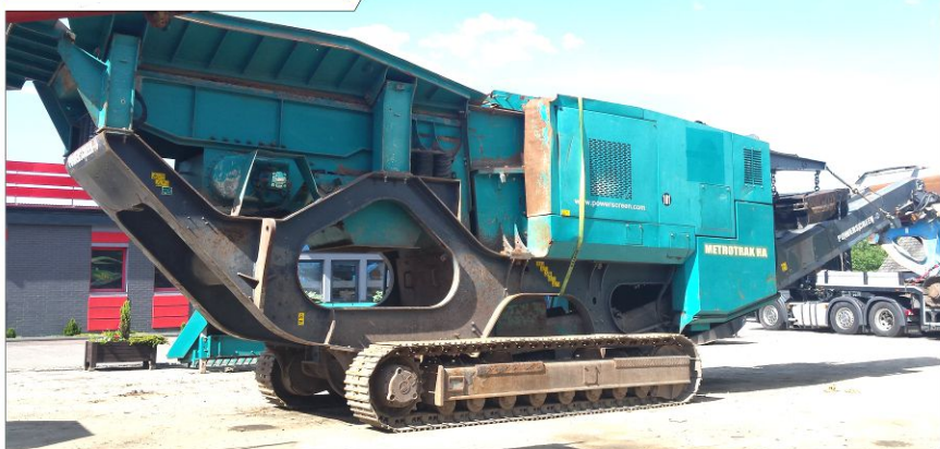
Kruszarka szczękowa POWERSCREEN Metrotrak HA