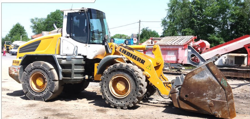
Ładowarka kołowa LIEBHERR L538