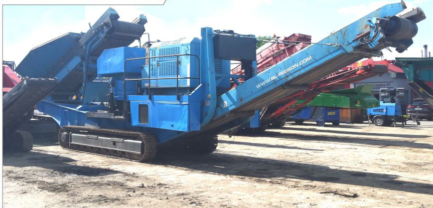
Kruszarka stożkowa TEREX Pegson 1000 Maxtrak