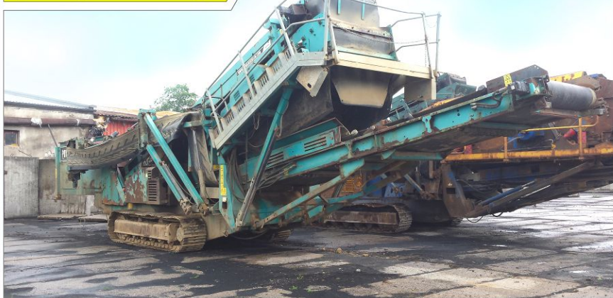
Przesiewacz POWERSCREEN Chieftain 1400