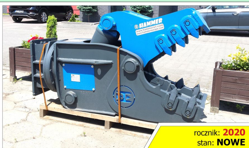
Nożyce wyburzeniowe HAMMER RH20