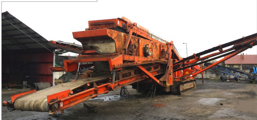
Przesiewacz TEREX Finlay 693