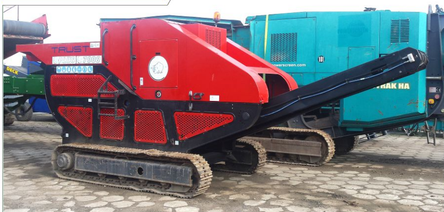
Kruszarka szczękowa RED RHINO 7000 Plus