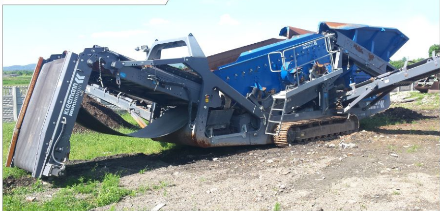
Przesiewacz KLEEMANN MS15Z-AD