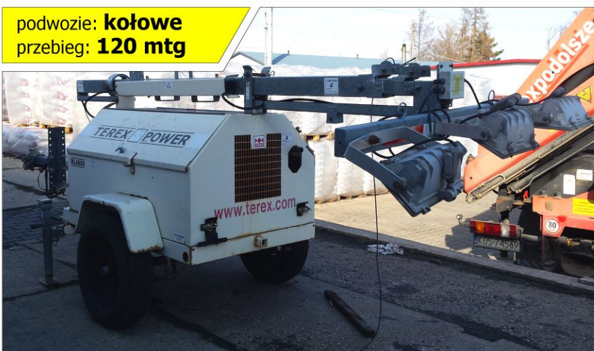
Maszt oświetleniowy TEREX RL4050D