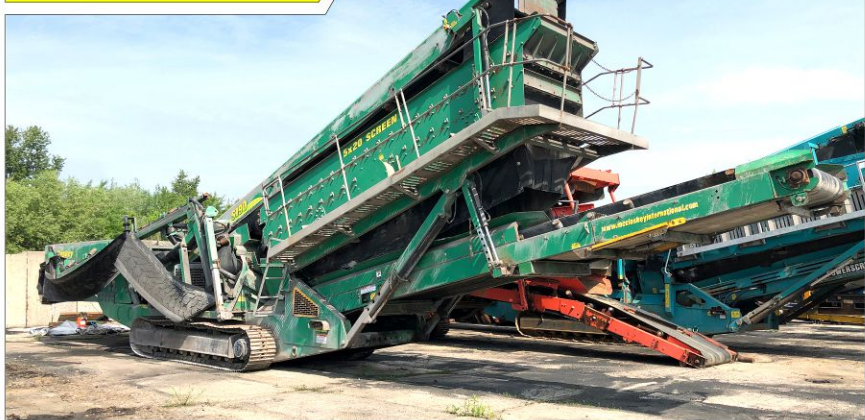
Przesiewacz McCLOSKEY S190 3-DECK