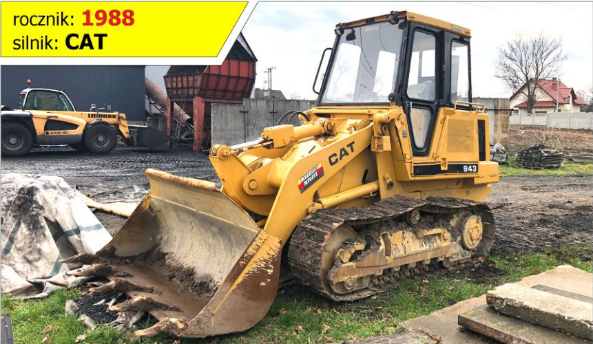
Spycharko - ładowarka CATERPILLAR 943