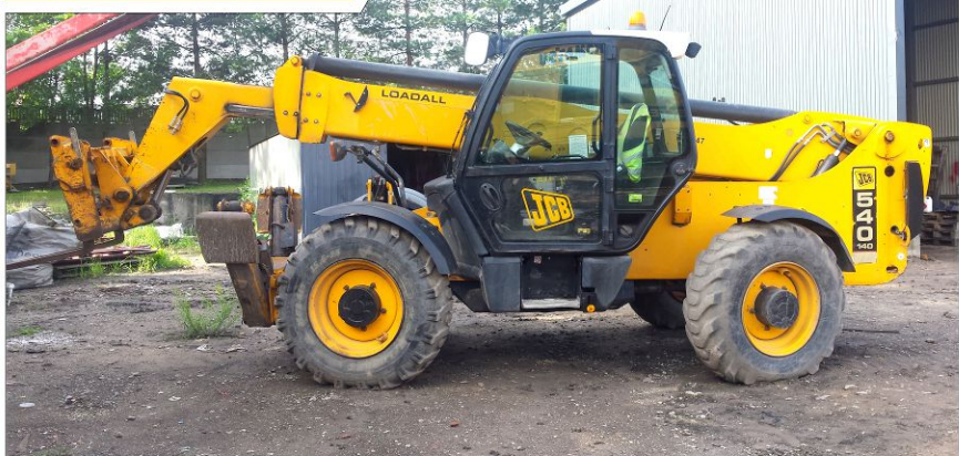
Ładowarka teleskopowa JCB 540-140