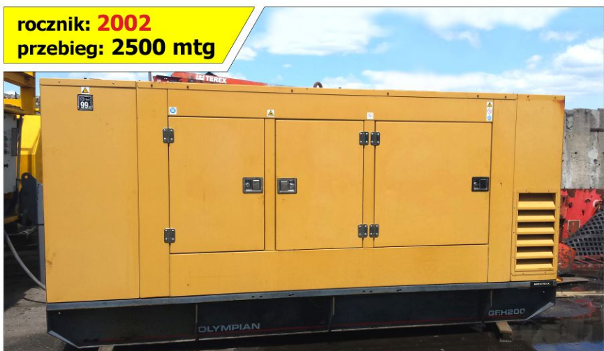
Generator prądu OLYMPIAN GEH200