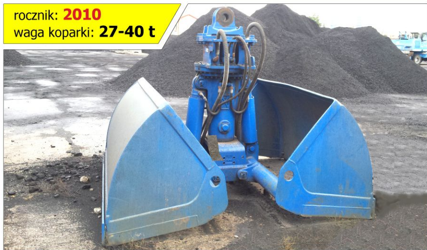
Łyżka czerpakowa ARDEN BA603R201