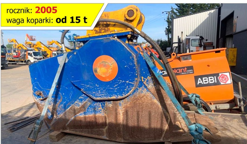
Łyżka krusząca MB BF 70.2