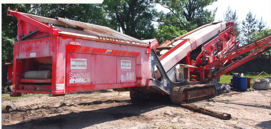
Przesiewacz SANDVIK QA440