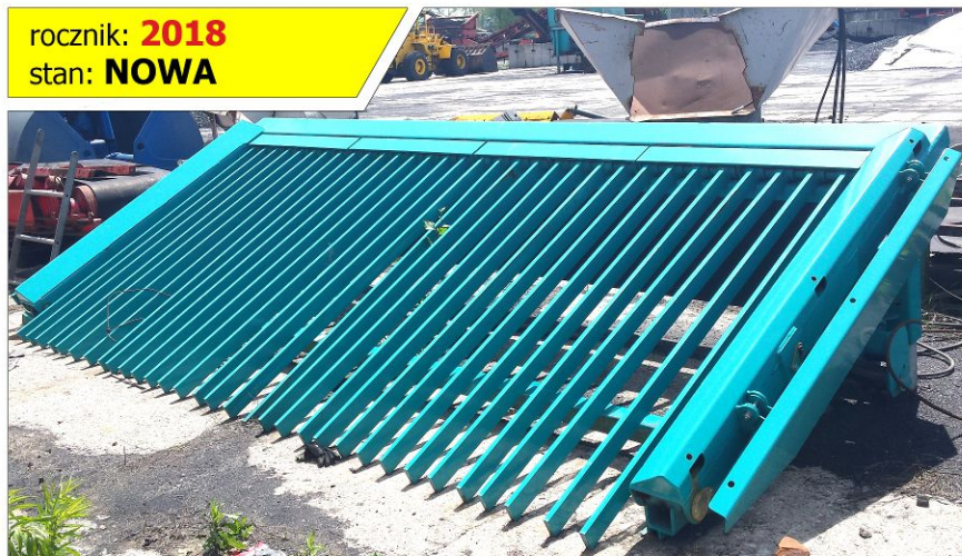
Krata zasypowa ukośna do przesiewacza POWERSCREEN