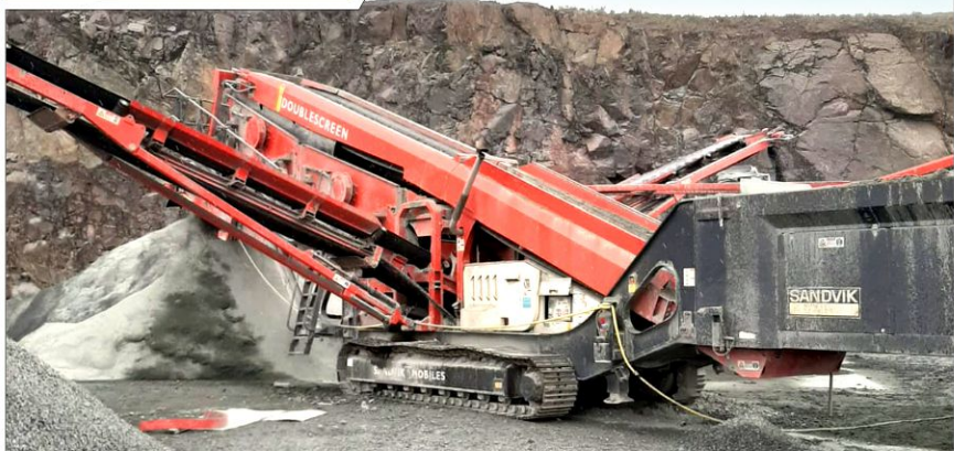
Przesiewacz SANDVIK QA451 3-DECK