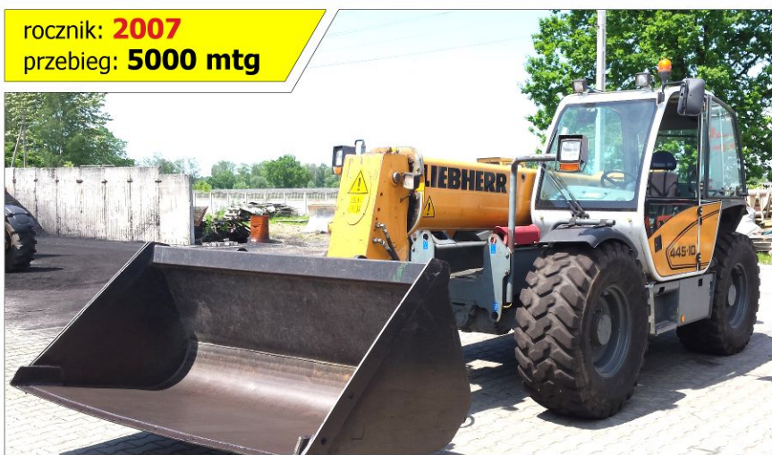
Ładowarka teleskopowa LIEBHERR TL 445-10