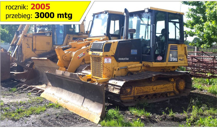
Spycharka KOMATSU D31PX-21