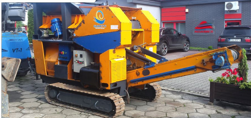
Kruszarka szczękowa GUIDETTI Caesar 1