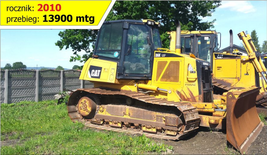
Spycharka CATERPILLAR D6K LGP