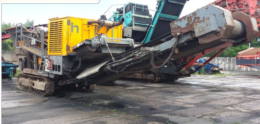
Kruszarka udarowa HARTL PC106I