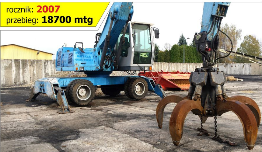
Maszyna przeładunkowa TEREX Fuchs MHL 340