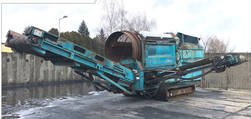
Przesiewacz bębnowy POWERSCREEN Trommel 511