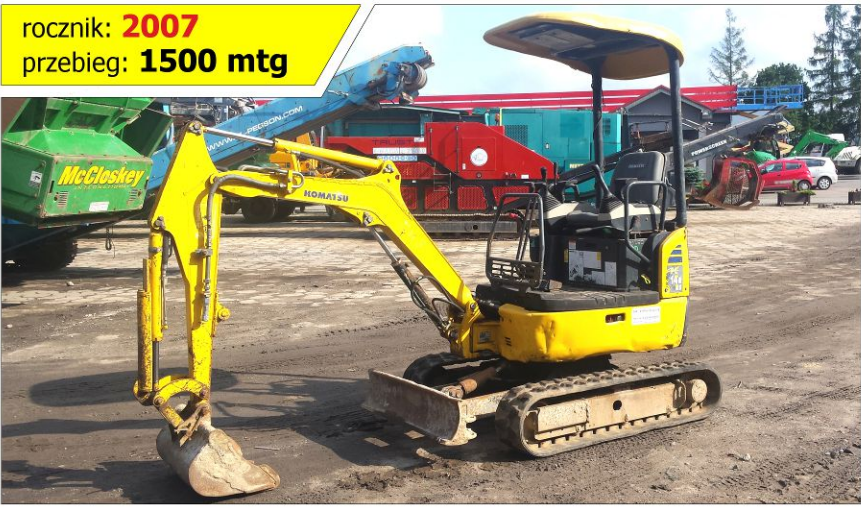
Koparka gąsienicowa KOMATSU PC14R