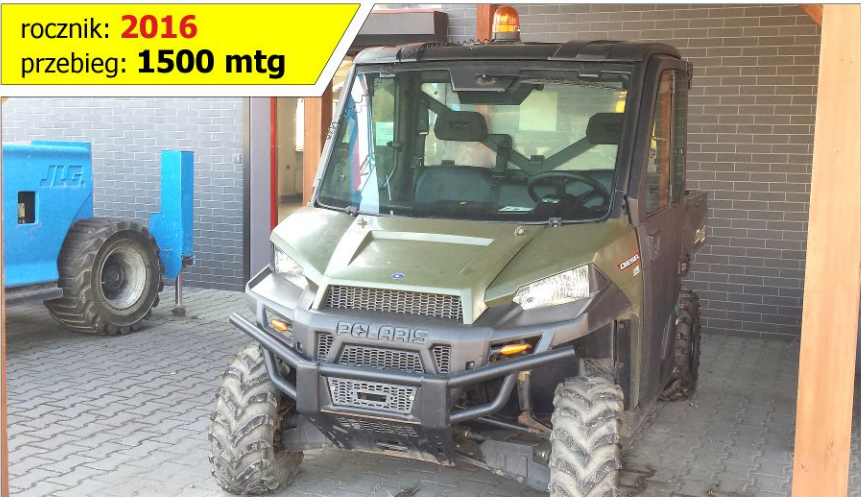
Pojazd użytkowy (UTV, ATV) POLARIS Ranger 1000