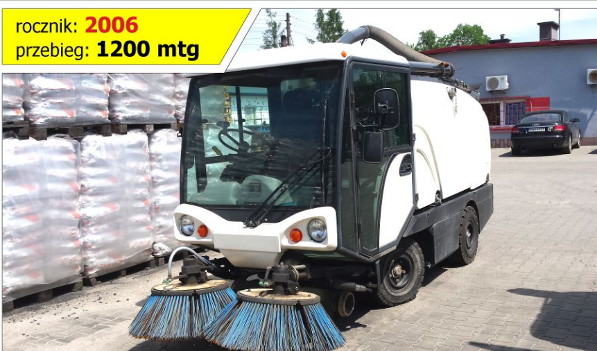
Zamiatarka JOHNSTON VL40