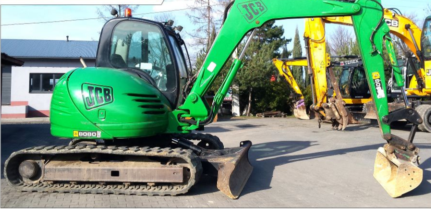
Koparka gąsienicowa JCB 8080 ZTS