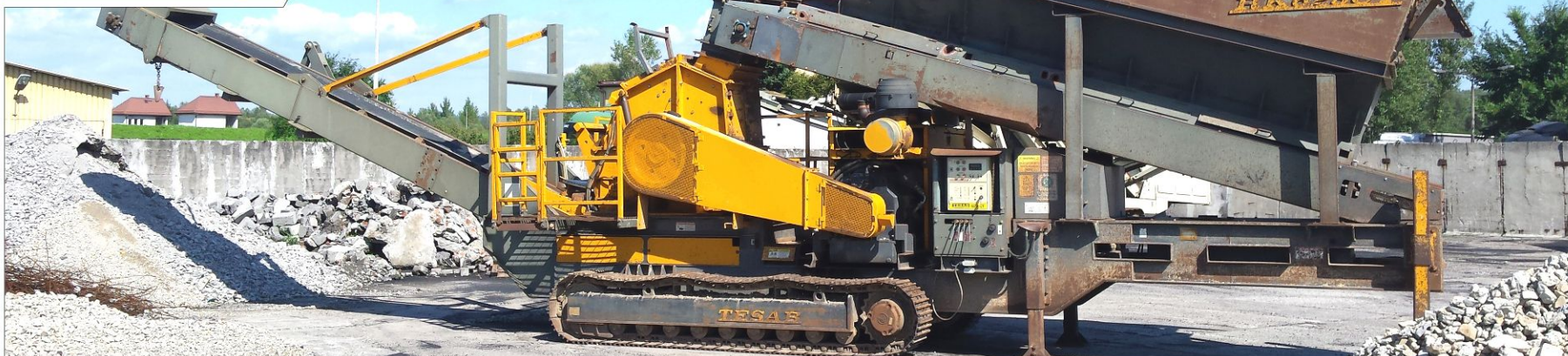
Kruszarka udarowa TESAB RK 623 CT