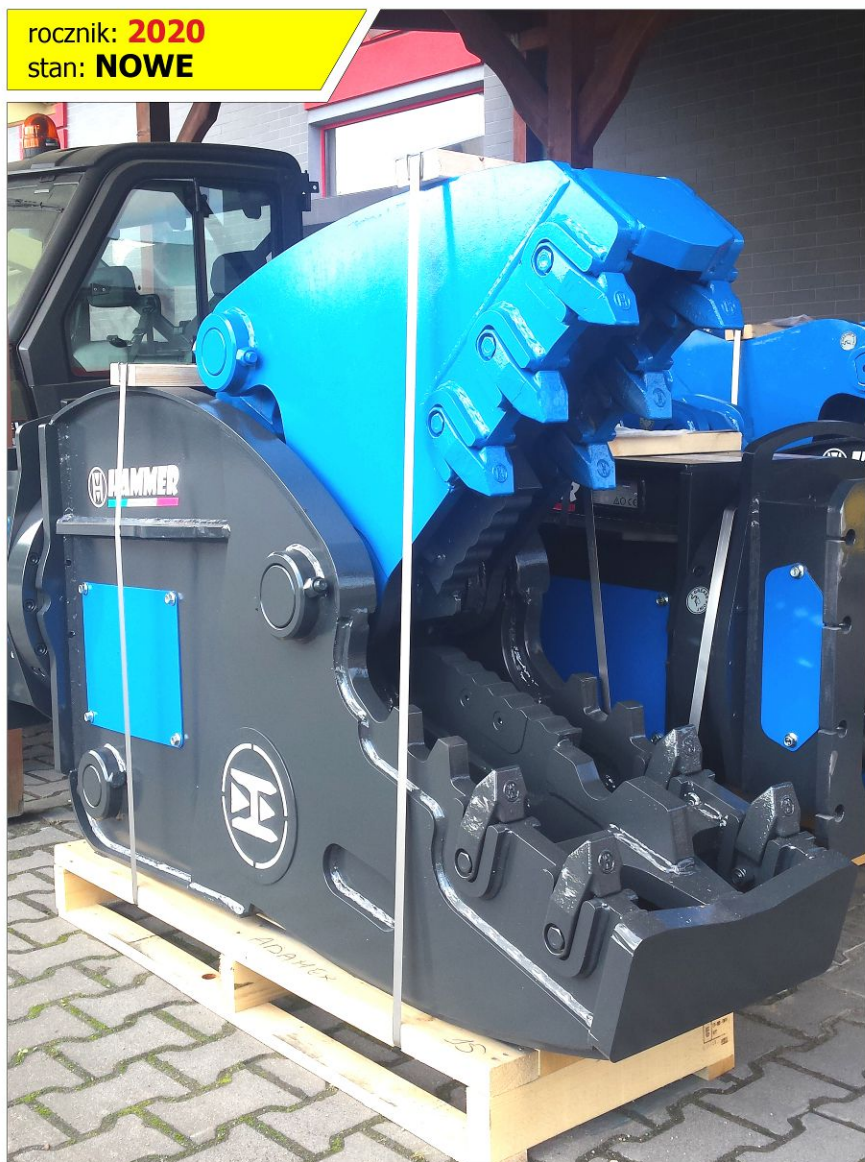
Nożyce wyburzeniowe HAMMER RH15