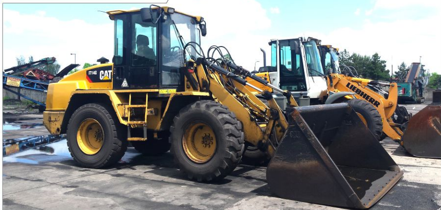
Ładowarka kołowa CATERPILLAR IT14G