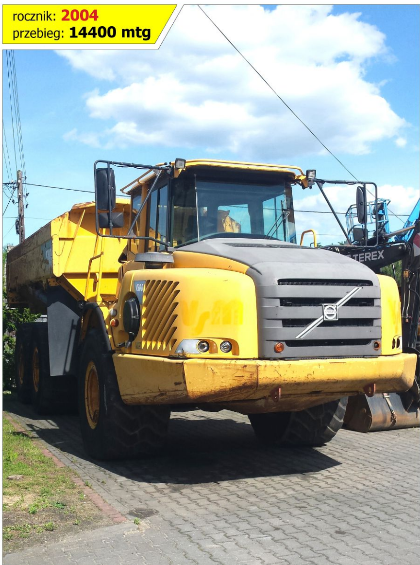
Wozidło VOLVO A30D