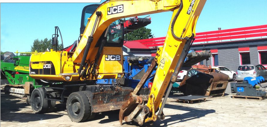
Koparka kołowa JCB JS160W High Cab