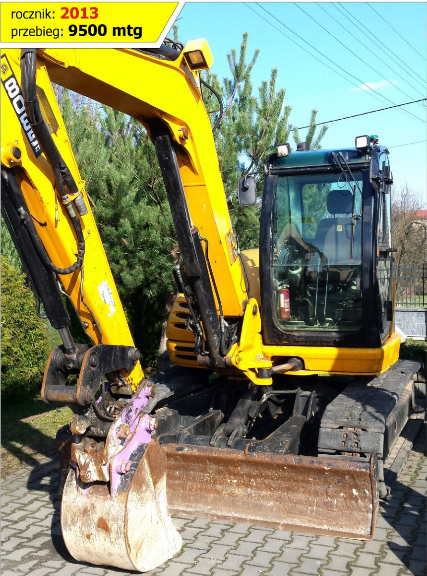
Koparka gąsienicowa JCB 8085