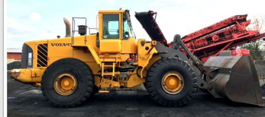
Ładowarka VOLVO L220E (2006)