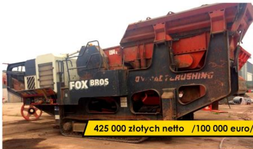
Kruszarka SANDVIK QJ240 (2010)