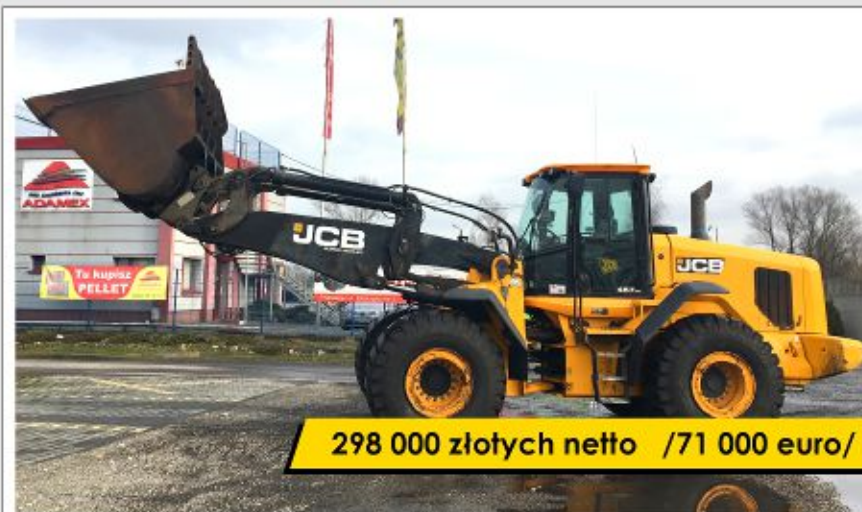
Ładowarka JCB 457 HT (2013)