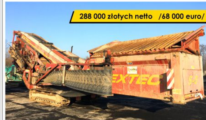
Przesiewacz EXTEC S5 (2007)