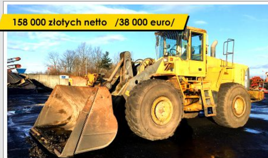
Ładowarka VOLVO L150E (2005)