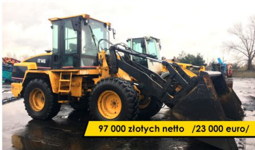
Ładowarka CATERPILLAR IT14G (1996)