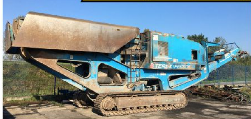
Kruszarka TEREX PEGSON PREMIERTRAK (2006)