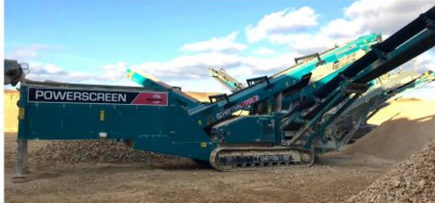
Przesiewacz POWERSCREEN Chieftain 1700 (2012)