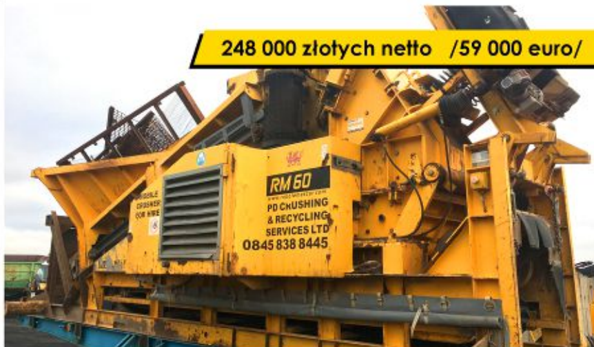
Kruszarka RUBBLE MASTER RM 60 (2008)