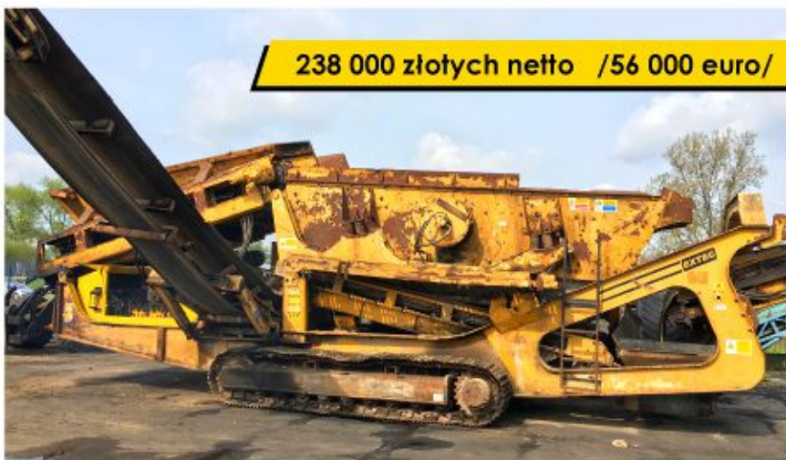
Przesiewacz EXTEC E7 (2006)