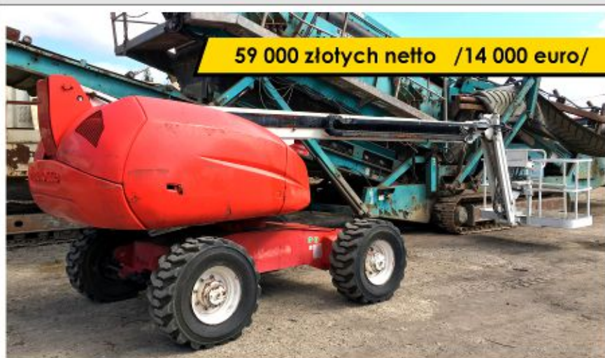
Podnośnik HAULOTTE H16 TPX (2006)