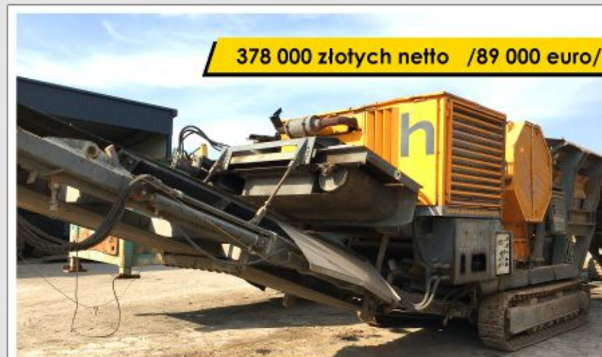
Kruszarka HARTL PC 1055J (2007)