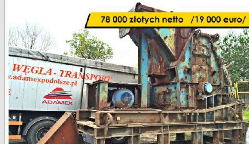
Kruszarka LEGMET KDU 120-130 (2002)