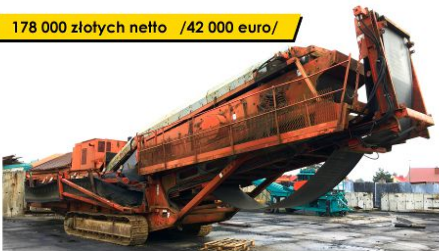
Przesiewacz TEREX FINLAY 693 (2001)