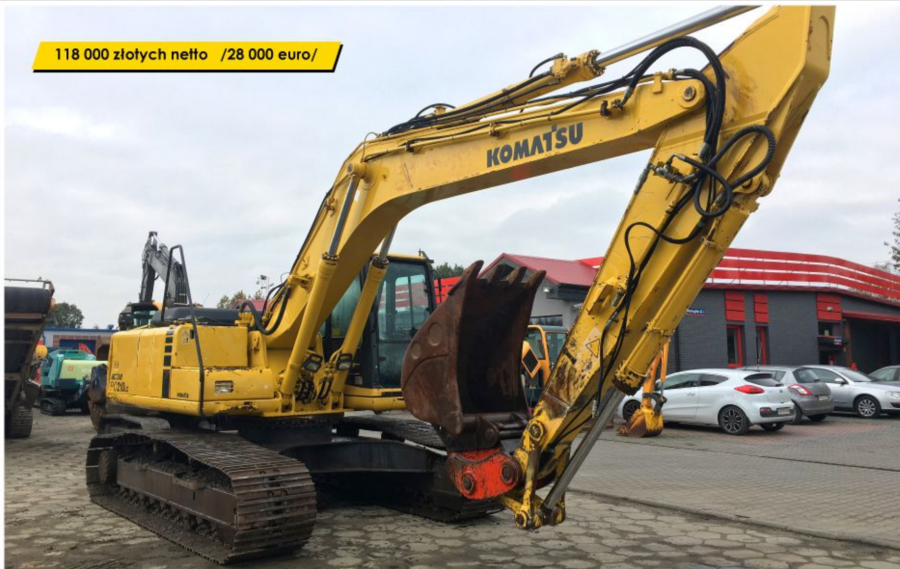
Koparka KOMATSU PC 210 LC (2002)