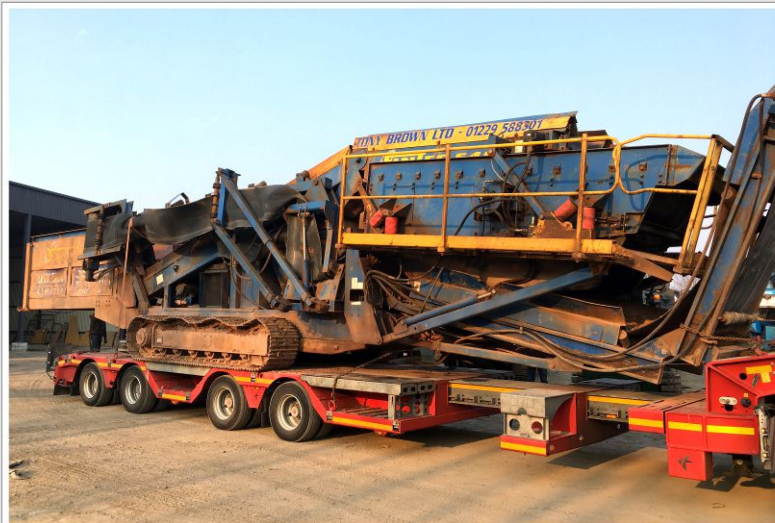
Przesiewacz FINTEC 540 (2004)