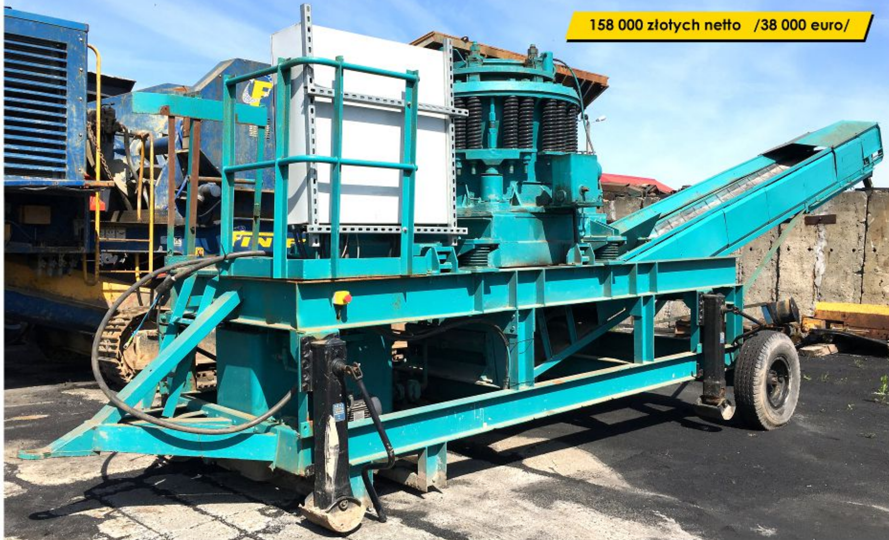
Kruszarka PREROVSKE Strojirny DKT (2001)