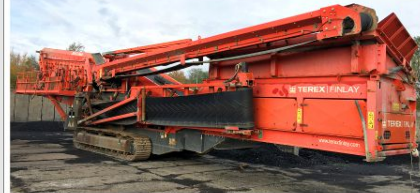
Przesiewacz TEREX FINLAY 694+ (2010)