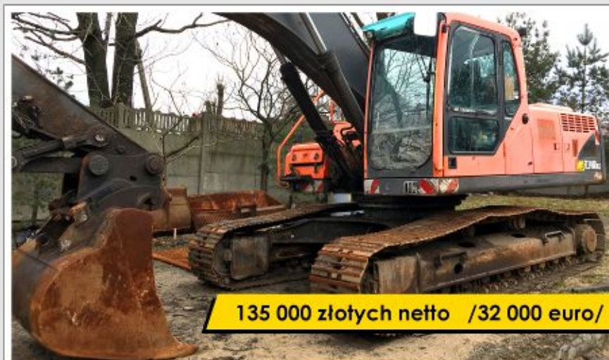
Koparka VOLVO EC240B NLC (2006)