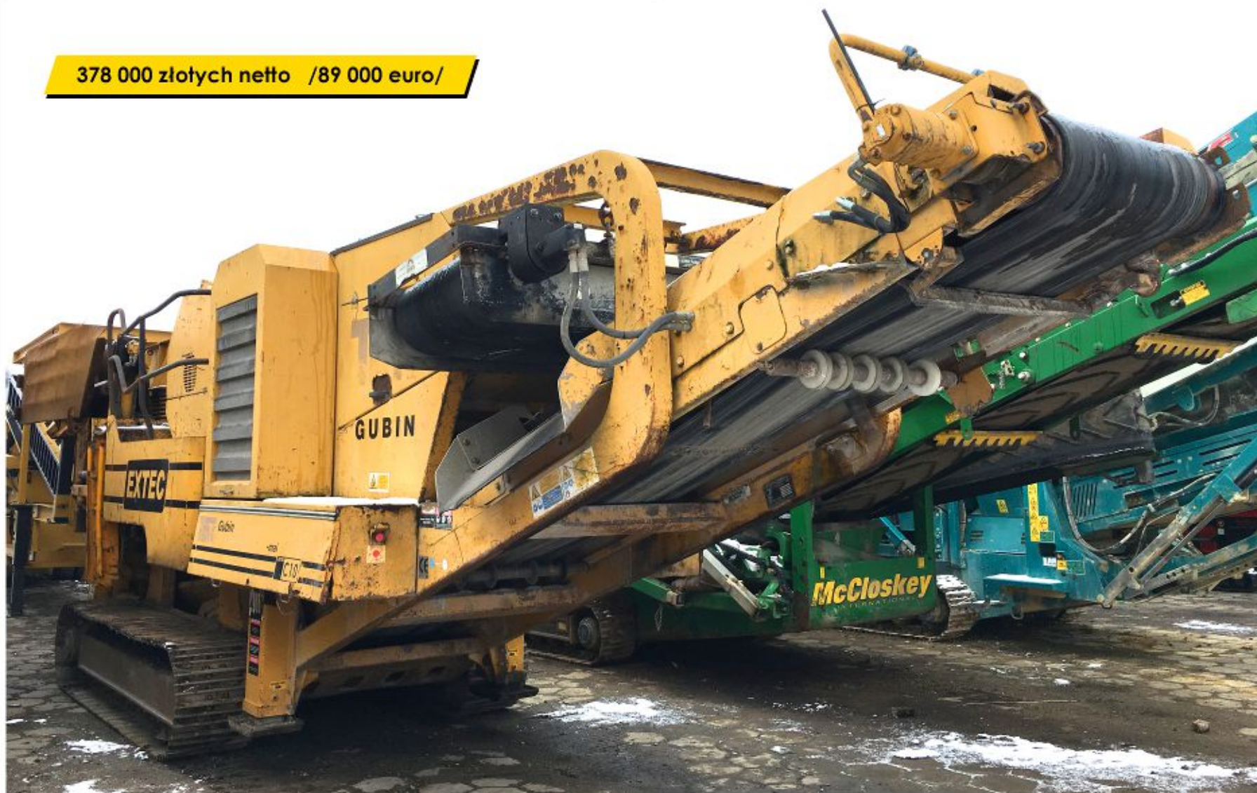
Kruszarka EXTEC C10 (2006)