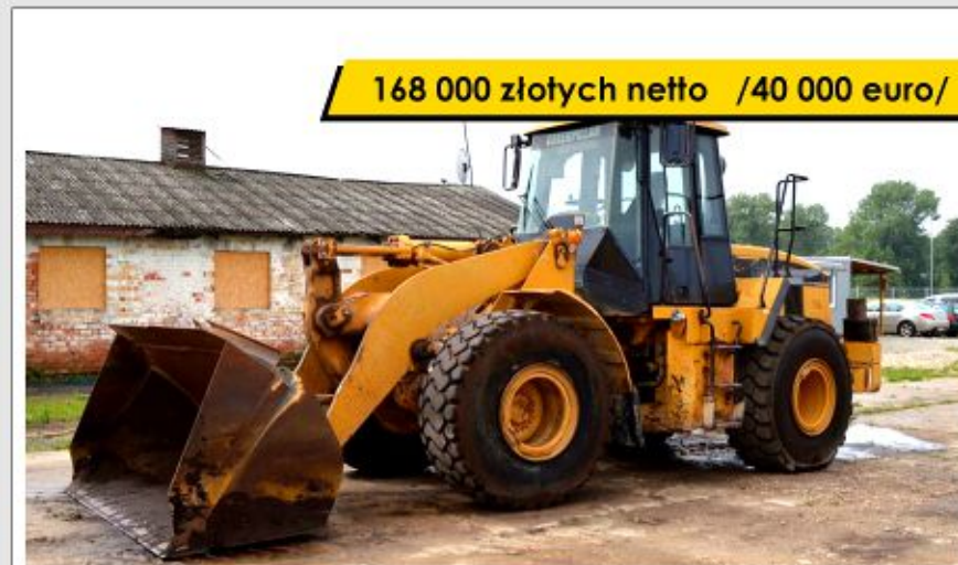
Ładowarka CAT 962G Series II (2005)