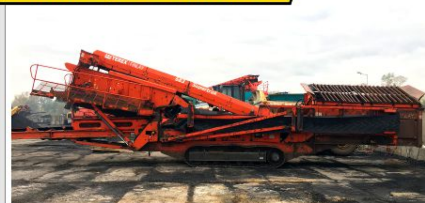
Przesiewacz TEREX FINLAY 683 (2005)