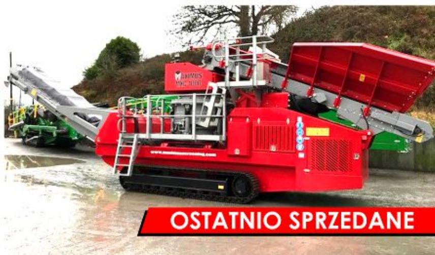
Kruszarka MAXIMUS MXC 1000 (2017)