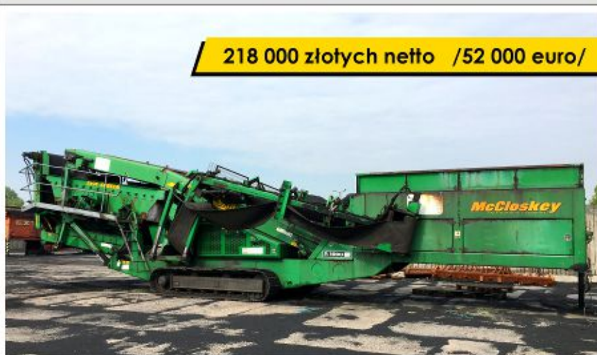
Przesiewacz McCloskey S130 (2007)