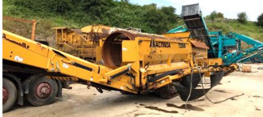
Przesiewacz ANACONDA TD 516 (2013)