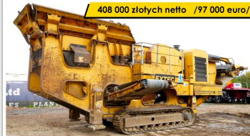
Kruszarka EXTEC C10+ (2008)