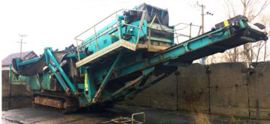
Przesiewacz POWERSCREEN Chieftain 1400 (2008)