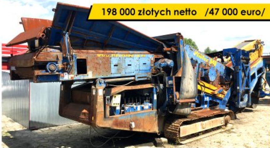
Przesiewacz FINTEC 640 (2005)