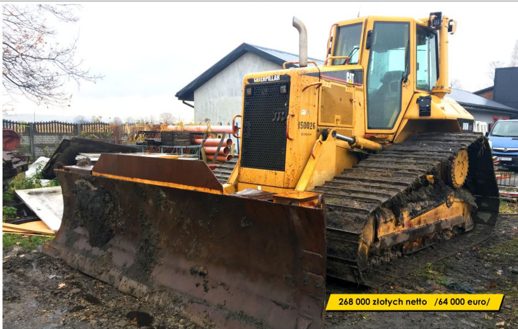
Spychacz CATERPILLAR D6N LGP (2006)