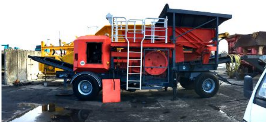
Kruszarka MABGO (1993)