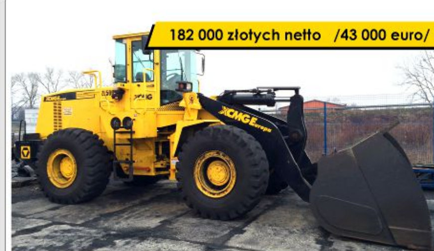
Ładowarka XCMG ZL50G (2010)