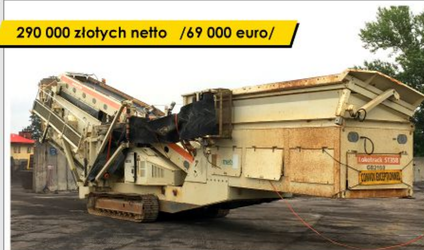
Przesiewacz METSO Lokotrack ST 358 (2008)