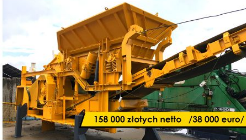
Kruszarka BOHRINGER RC-7C (1994)