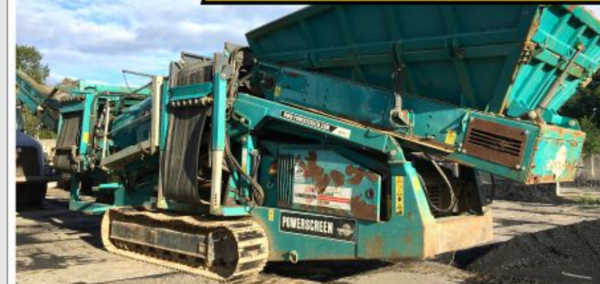
Przesiewacz POWERSCREEN Warrior 1400 (2007)