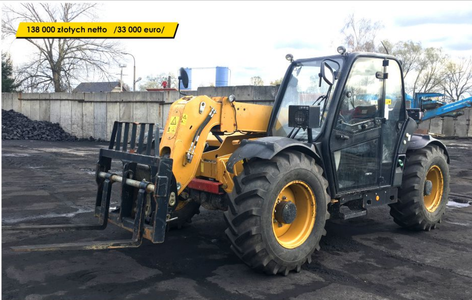
Ładowarka CAT TH406 (2011)