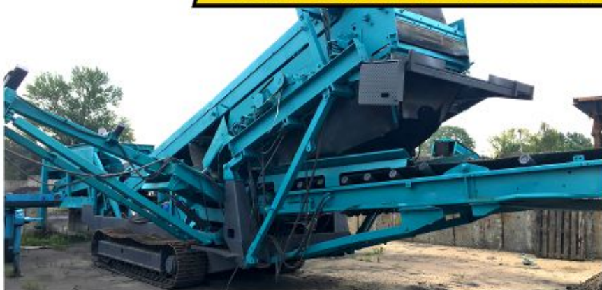
Przesiewacz POWERSCREEN Chieftain 1400 (2002)