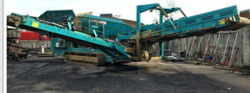
Przesiewacz POWERSCREEN Warrior 1800 (2011)