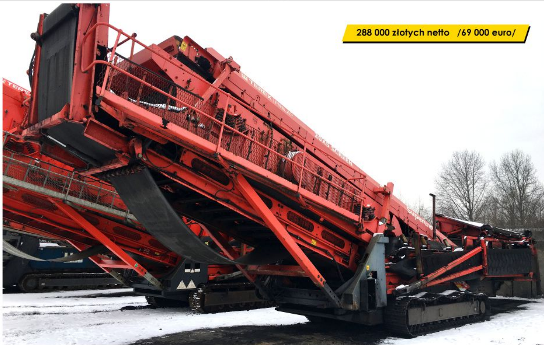
Przesiewacz TEREX FINLAY 693T (2008)