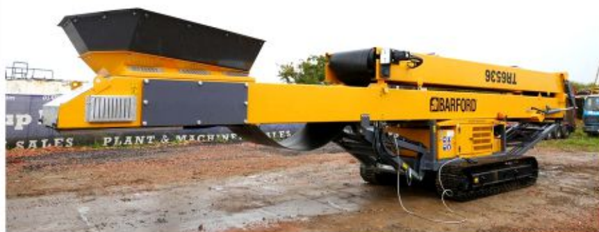
Taśmociąg BARFORD TR6536 (NOWY)